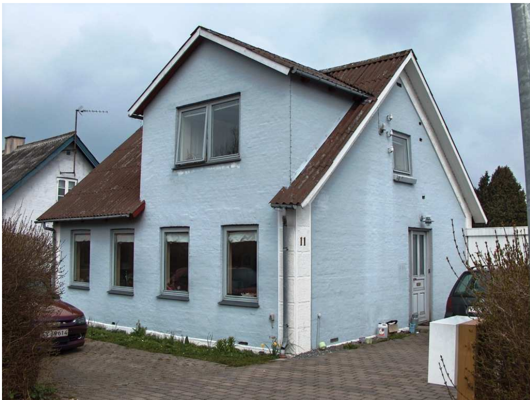
13. april 2012